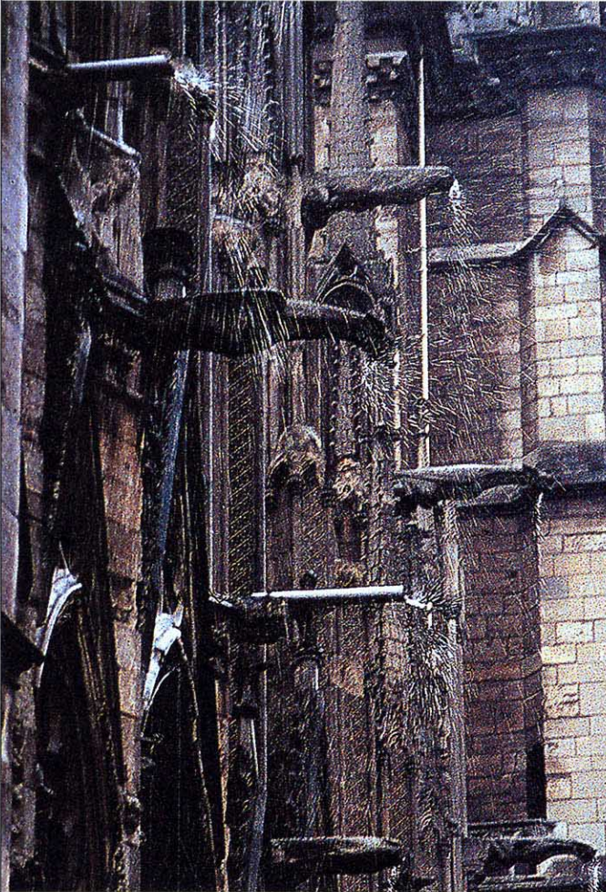
Mehr Starkniederschlag – mehr Schäden? (Notre Dame, Paris /P. Storemyr)

Climate change, Klimaveränderung, Klimaerwärmung – fast täglich werden wir in den Medien, im Internet oder in der Fachliteratur mit diesen Begriffen konfrontiert. Die möglichen Auswirkungen der Klimaerwärmung, wie z.B. heftigere Stürme, vermehrter Starkniederschlag, Überschwemmungen, Erdbeben, Steinerschlag, Gletscherschwund, auftauender Permafrost, steigende Baumgrenzen, längere Trockenperioden, extreme Hitzeereignisse usw. sind längst seriöse Forschungsthemen. Und auch die Bau- und Versicherungsbranchen machen sich Sorgen, weil die Gefährdung für die moderne Infrastruktur, für den Tourismus und auch für die Menschen (vgl. die Hitzewelle 2003) zuzunehmen scheint. Ein Beispiel ist die kürzlich gegründete Präventionsstiftung der kantonalen Gebäudeversicherungen.