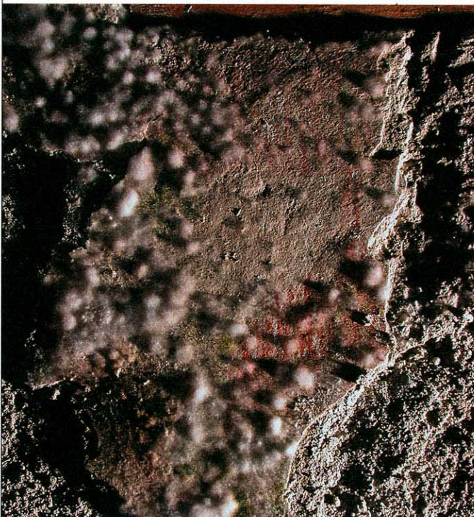
Nimmt die Schimmelpilzbildung zu? Bildbreite ca. 15 cm

Da auch im Erzbischofspalast kurz zuvor Konservierungsmassnahmen abgeschlossen worden waren, ist zu vermuten, dass