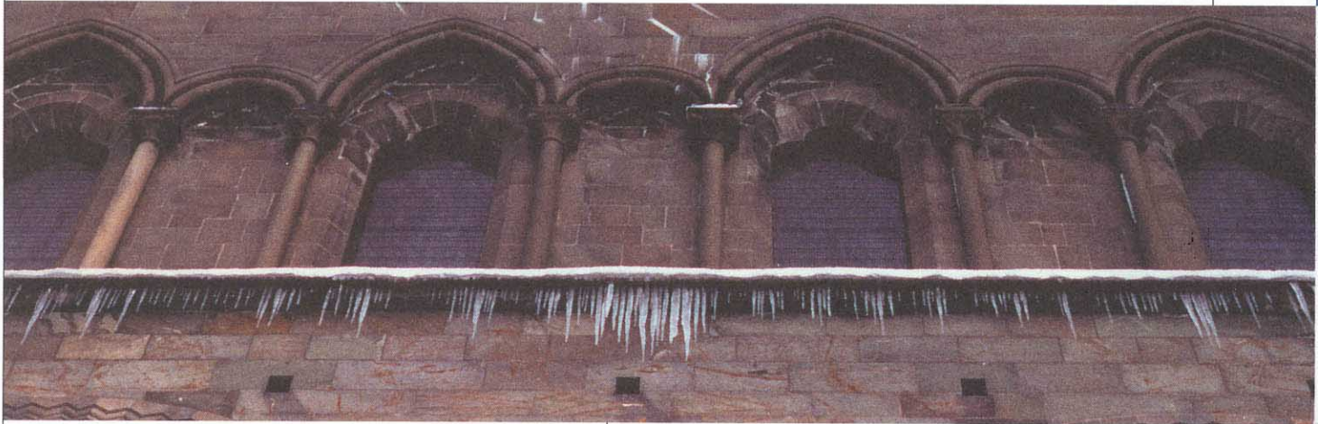
Eiszapfen – sind sie bald Geschichte? (Kathedrale, Trondheim)

im benachbarten Fachbereich der Naturkatastrophenforschung. Weil uns die Forschungswerkzeuge auch für das Verständnis des gegenwärtigen Klimas und seiner (Verwitterungs)folgen noch manchmal fehlen, gibt es wohl keine andere Möglichkeit als zuerst diese Werkzeuge zu entwickeln sowie die Verwitterungsgeschichte von Einzelbauten und Gruppen von Denkmälern in relevanten Regionen aufzuarbeiten.