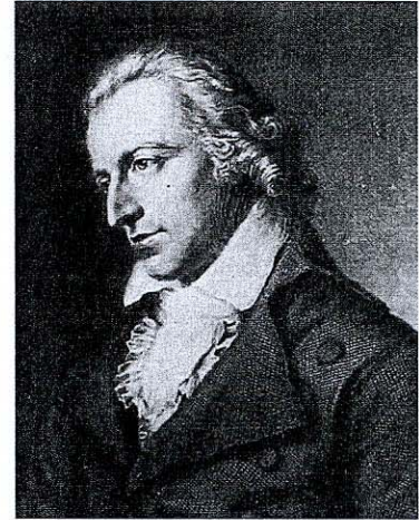
Architektur im Kontext