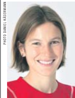
Simone Niggli-Luder, sportive de l'année 2005: «Je trouve important de m'engager bénévolement, sans contrepartie financière.»

Le Pour-cent culturel Migros lance un concours pour les écoles dont le but est réaliser un projet pour le bien commun. Beaucoup d'écoles s'engagent bénévolement, elles vendent des objets faits mains pour la bonne cause, nettoient des ruisseaux, organisent des courses de soutien. Cet engagement est un plus pour la communauté, et aussi pour le développement des enfants et des ados. Le Pour-cent culturel Migros souhaite donner de la visibilité à cet engagement altruiste. Elle lance donc le concours «x-puissance-cœur» pour l'année scolaire 2006/07. Toutes les classes et écoles prêtes à réaliser un projet sur le thème «S'engager pour autrui» peuvent participer (jusqu'au 16 février 2007). Le Pour-cent culturel recherche donc des enseignants créatifs et pleins d'initiative! Avec x-puissance-cœur, tout le monde est gagnant: la communauté, les enseignants et les élèves. Et en participant au concours x-puissance-cœur, chacun reçoit un petit prix. De plus, les projets les plus créatifs se voient attribuer une récompense supplémentaire: la réalisation d'un vœu.